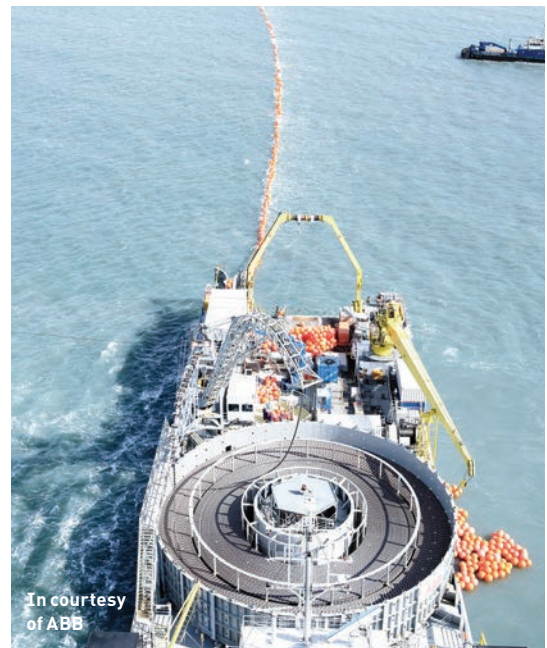
Fartyget Topaz Installer används för att lägga ned de första 150 kilometerna kabel från den litauiska kusten.

Det är viktigt att känna till att de fartyg som